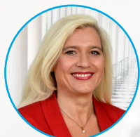
Melanie Huml, MdL Staatsministerin für Europaangelegenheiten und Internationales

„Mit der Stiftung Jugendaustausch schaffen wir hervorragende Chancen für die Jugendlichen in Bayern. Mir ist wichtig, dass jeder junge Mensch die Chance bekommt ins Ausland zu gehen, um andere Kulturen, Sprachen und internationale Zusammenhänge zu erlernen und zu verstehen. Damit fördern wir das Zusammenwachsen in Europa und der Welt.“